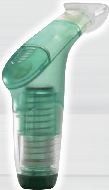
POWERbreathe Wellness Plus Für Nicht-Sportler und ältere Personen Pour personnes peu sportives et aînés