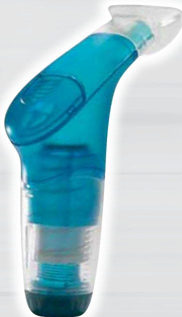
POWERbreathe Fitness Für Fitness-Interessierte Pour adeptes du fitness