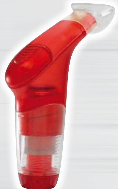
POWERbreathe Sport Für Leistungssportler Pour sportifs de compétition