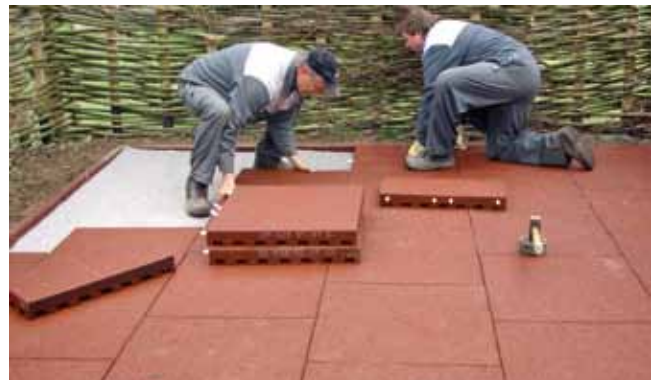
Aufbau: Fallschutzplatten Couche de surface: plaques de protection en cas de chute