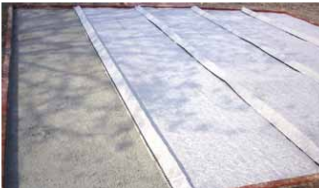
Unterbau: Softsystem Infrastructure: système soft