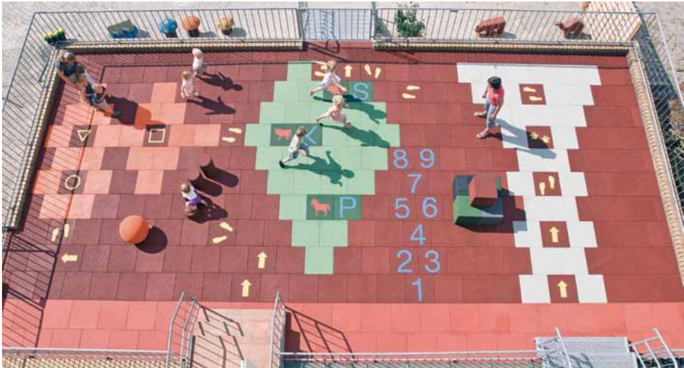
Gestaltungsbeispiel mit EPDM- und Symbolplatten Par exemple la conception avec EPDM et le symbole de conseils