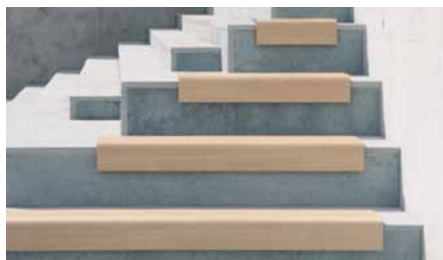
Farbmuster/Couleurs il posto & il posto XL

Sitzfläche: Duomere Hochrucklaminatplatte Siège: laminé duromère