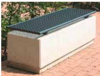
Zweierbank banc à deux places

Für Preise und Masse fragen Sie uns unverbindlich an! Pour prix et dimensions, demandez-nous des précisions sans engagement de votre part!