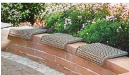
Hockerauflage einzel gerundet siège individuel arrondi