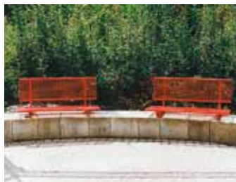
Bankauflage mit Lehne banc avec dossier