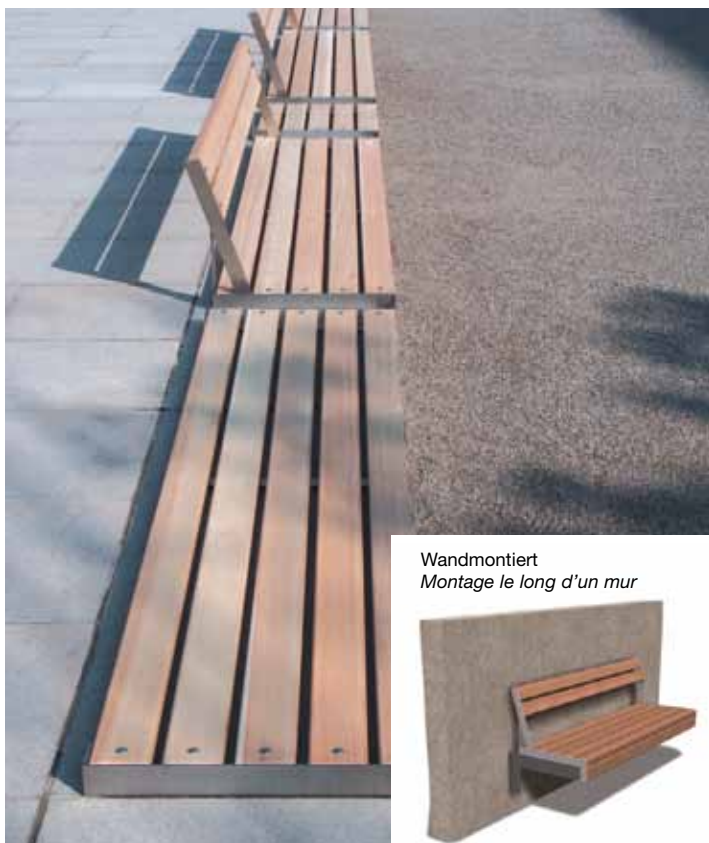
Wandmontiert Montage le long d'un mur