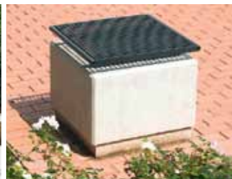
Hockerauflage mono siège mono