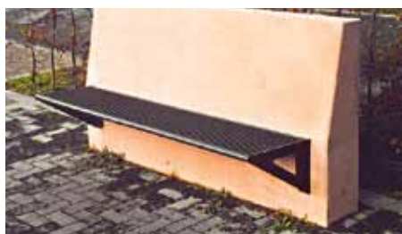
Bank für Wandmontage banc pour montage mural