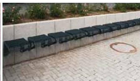
Einzelsitz für Wandmontage siège individuel pour montage mural