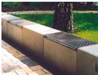
Integrierte Bankauflage banc intégré