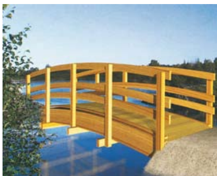
Brücke / Pont 000735

# 000735 370/220 cm Innenbreite / largeur intérieure 161 cm