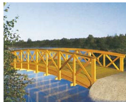
Brücke / Pont 000735

# 000725 490/220 cm Innenbreite / largeur intérieure 161 cm