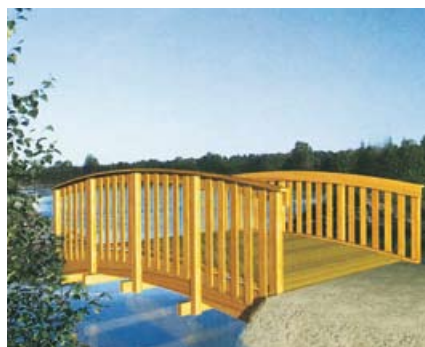
Brücke / Pont 000725

# 000735 370/220 cm Innenbreite / largeur intérieure 161 cm