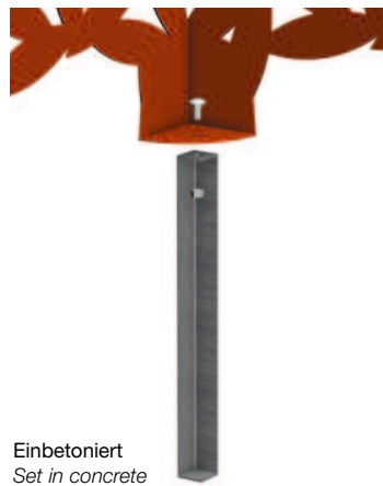
Einbetoniert Set in concrete