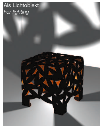
Als Lichtobjekt For lighting