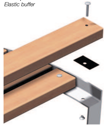
Lattenpuffer Elastic buffer