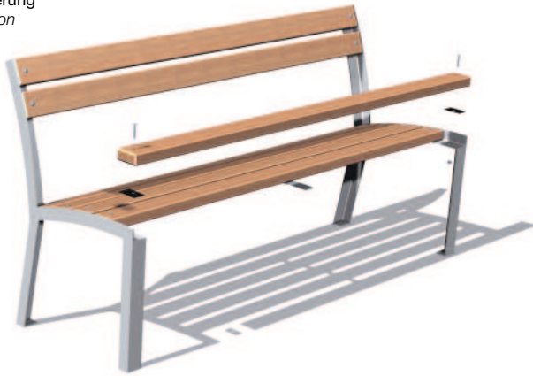
Lattenfixierung Slats fixation