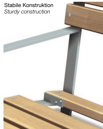
Stabile Konstruktion Sturdy construction