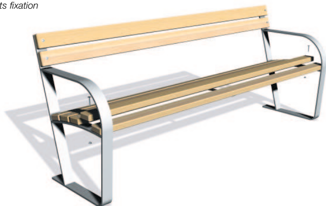
Lattenfixierung Slats fixation